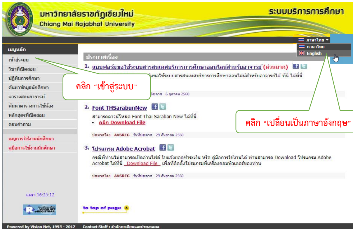
รูปที่ 1 หน้าจอหลักเมื่อเข้าสู่ระบบ

ใช้โปรแกรม Internet Explorer หรือ Microsoft Edge ที่ URL http://reg4.cmru.ac.th