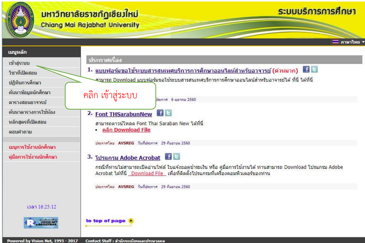
รูปที่ 1 หน้าจอหลักเมื่อเข้าสู่ระบบ

เริ่มต้นการใช้งานระบบบันทึกประวัตินักศึกษาในระดับบัณฑิตศึกษา โดยใช้โปรแกรม Internet Explorer หรือ Microsoft Edge ที่ URL http://reg3.cmru.ac.th