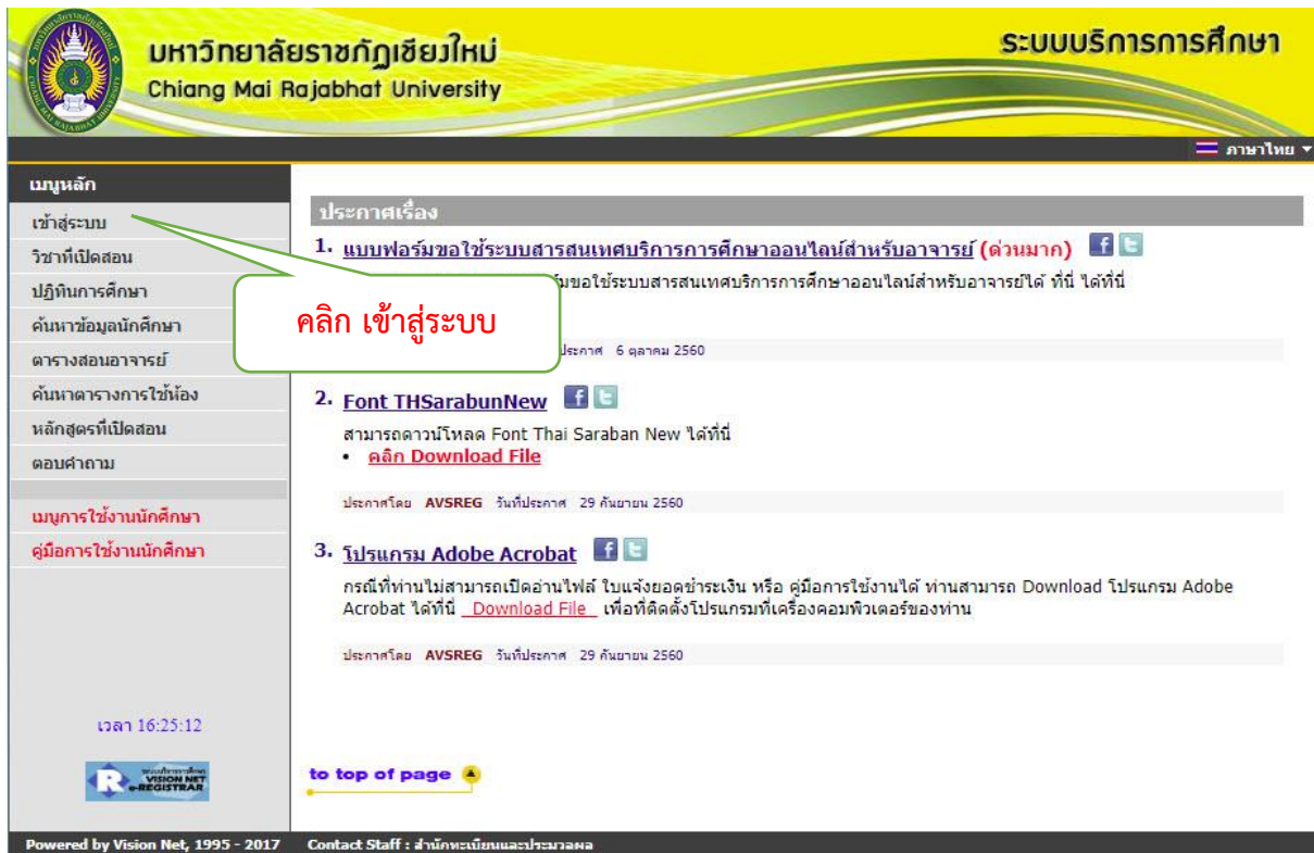
รูปที่ 1 หน้าจอหลักเมื่อเข้าสู่ระบบ

ใช้โปรแกรม Internet Explorer หรือ Microsoft Edge ที่ URL http://reg4.cmru.ac.th